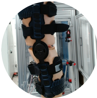
SecuTec Genu Flex in testopstelling FH Münster